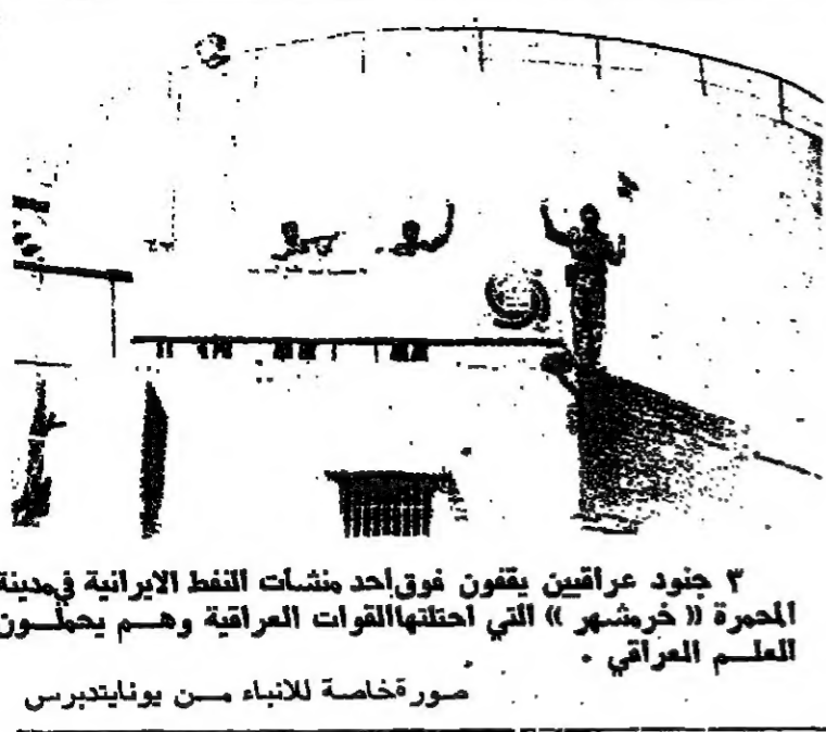
٣ جنود عراقيين يقفون فوق احد منشآت النفط الايرانية في مدينة المحرة ( خرمشهر ) التي احتلتها القوات العراقية وهم يحملون العلم العراقي .

وتكر راوي طهران امس ان السيد محمد علي رجائي رئيس الحكومة الايرانية البنية على م ٤٨ في الانتخابات بلغت حوالي ٩١ بالمائة .